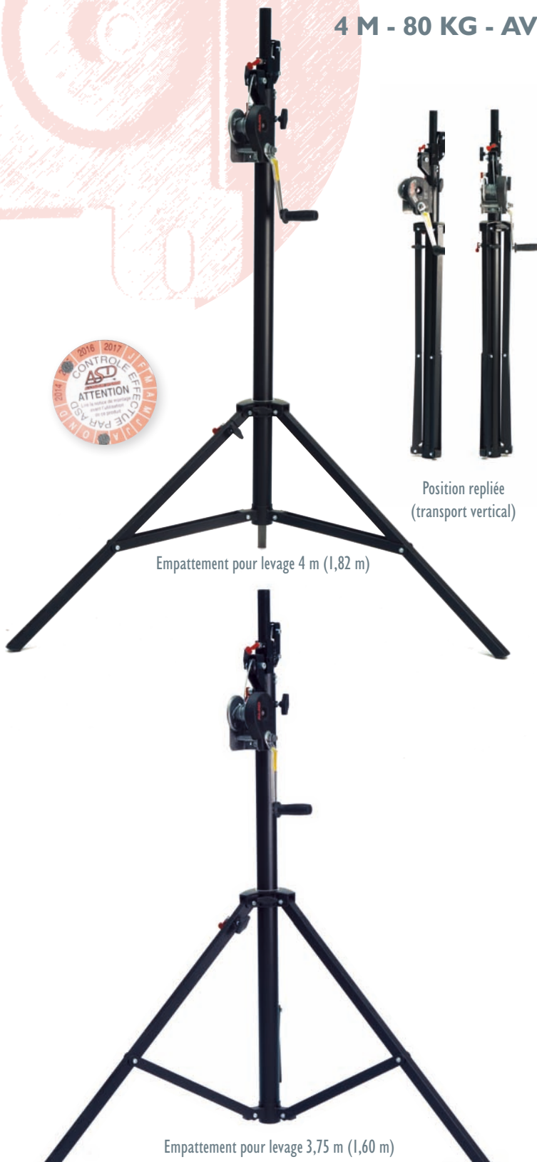
Empattement pour levage 4 m (1,82 m)