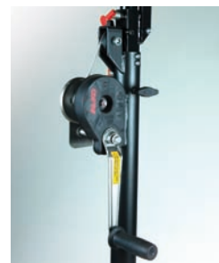
Treuil anti-retour freiné