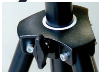
Chariot en aluminium coulé avec molette de serrage sur cale polyamide et bague téflon