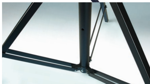
Pattes à double traverse